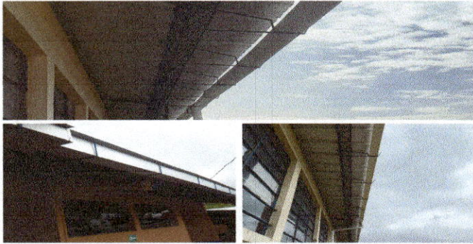
Foto1: Cambio de caletas y soportes en todo el establecimiento